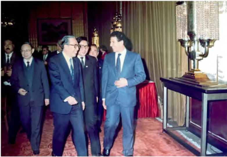
خلال استقبال رئيس وزراء كوريا الشمالية باك سونغ تشول لعبد السلام جلود، كوريا الشمالية.